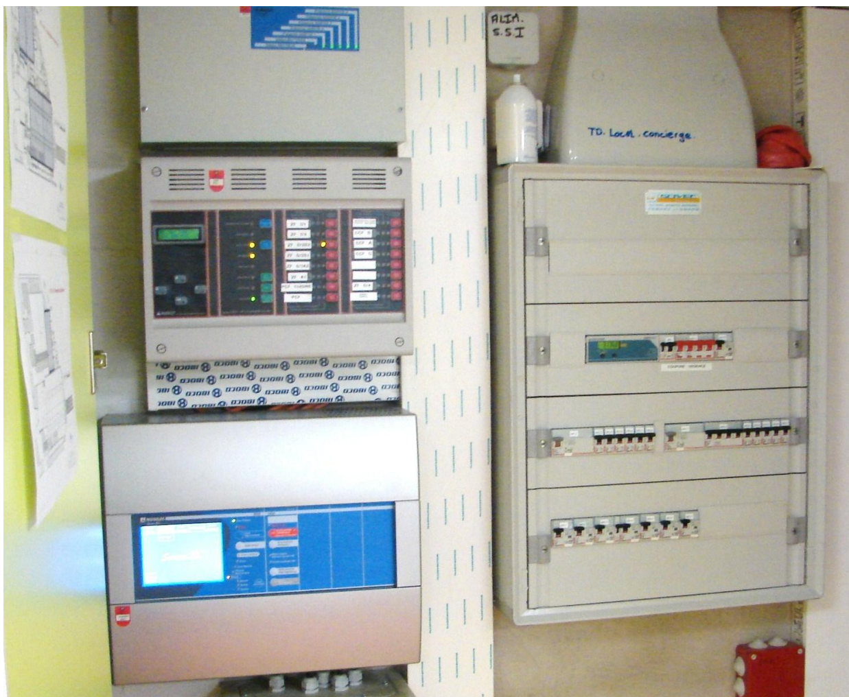
Arrêt général électrique