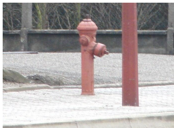
Le poteau d'incendie (Pompiers)

J.O. - N° 1685 – Article CO 2 – b) Etablissements de 1° catégorie de 2500 à 3500 personnes. Trois façades de 6 m, voie engin, une façade 8 m voie échelle, avec son aménagement voie engin. Un point d'eau MS 7.