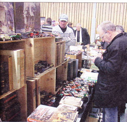
Des stands avec des miniatures, et surtout de l'automobilia comme on aime en dénicher dans les brocantes et vide-greniers : tout l'intérêt de ce salon "toutes collections".